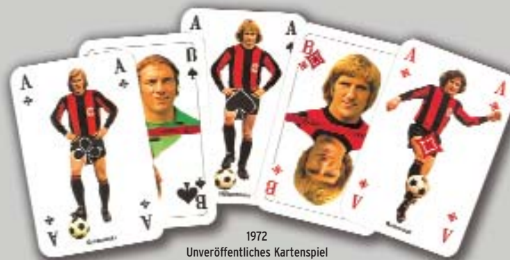
1972 Unveröffentlichtes Kartenspiel