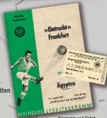
Programm und Ticket Riederwald-Eröffnung 1952