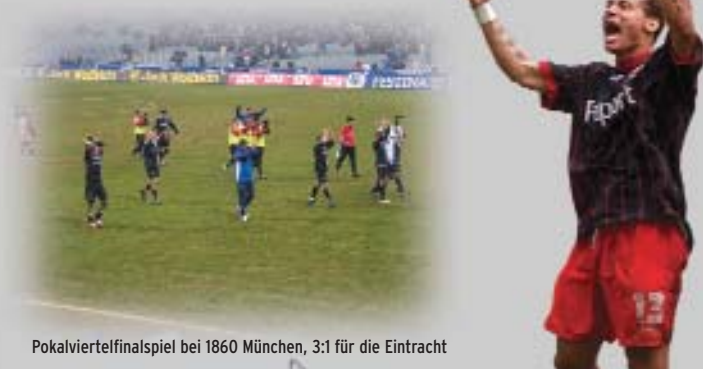
Pokalviertelfinalspiel bei 1860 München, 3:1 für die Eintracht

Sichern Sie sich Ihr persönliches Exemplar! Im Herzen von Europa... Eintracht Frankfurt! Die Geschichte eines der bekamesten Fußballvereine Europas in Bildern. Großformatiger Farbdruck, Hardcover, 256 Seiten mit mehr als 1.500 Abbildungen. Wer das Buch bis zum 1.10.2006 verbindlich bestellt und bezahlt, profitiert gleich mehrfach: • Sonderpreis 59,90 statt 69,90 Euro • Nummeriertes Exemplar und namentliche Erwähnung des Vorbestellers im Buch (auf Wunsch mit Angabe zur Mitgliedschaft in Verein und/oder Fanclub) • Handschriftlich signiert von Eintrachtgrüßern und Autoren...plus eine Überraschung! Jetzt bestellen! Eintracht Rückseite ausfüllen und an den AGON-Sportverlag senden!