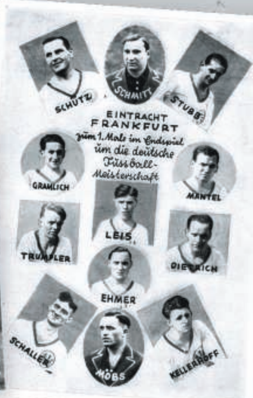
EINTRACHT FRANKFURT zum 1. Mal im Endspiel um die deutsche Fußball-Meisterschaft