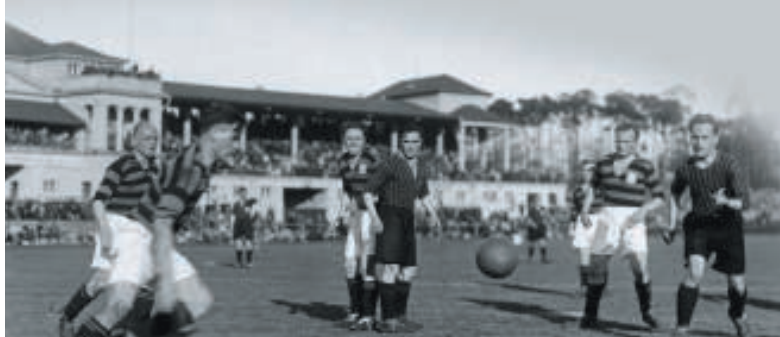
Frankfurter Derby im Waldstadion: FSV gegen Eintracht im April 1932

Da beide Finalisten für die Endrunde um die Deutsche Meisterschaft qualifiziert sind, lässt sich der Verband mit einer Entscheidung Zeit: Erst nach dem Meisterschafts-Endspiel wird die Eintracht zum Sieger erklärt, Bayern erhält eine Geldstrafe. Eben in diesem Endspiel, das am 12. Juni in Nürnberg ausgetragen wird, treffen die beiden Kontrahenten erneut aufeinander. Diesmal muss die Eintracht, die auf dem Weg ins Finale Hindenburg Allenstein (6:0), Tennis Borussia Berlin (3:1) und Schalke 04 (2:1) ausgeschaltet hat, allerdings eine bittere, gleichwohl verdiente Niederlage hinnehmen. Mit 2:0 triumphieren die Münchner vor 55.000 Zuschauern.