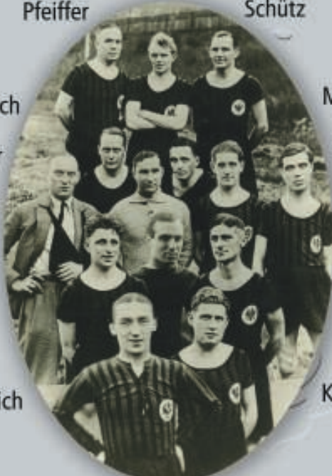
Eintracht Frankfurt in einer zeitgenössischen Fotomontage von 1932, daneben das Objekt der damaligen Begierde für den Deutschen Fußballmeister, die Victoria.