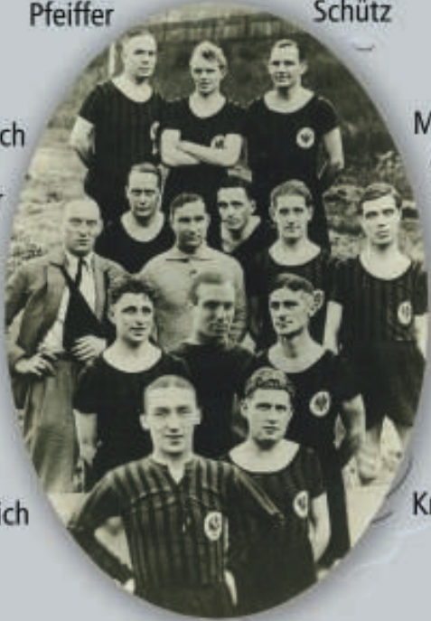
Eintracht Frankfurt in einer zeitgenössischen Fotomontage von 1932, daneben das Objekt der damaligen Begierde für den Deutschen Fußballmeister, die Victoria.