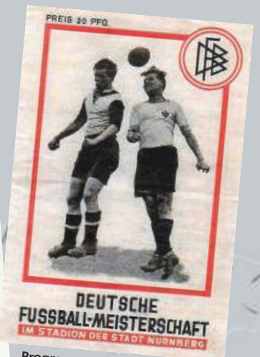
Programm zum Endspiel um die Deutsche Meisterschaft 1932 in Nürnberg