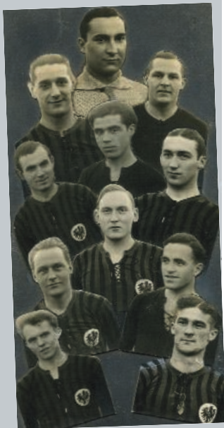
Eintracht Frankfurt 1932