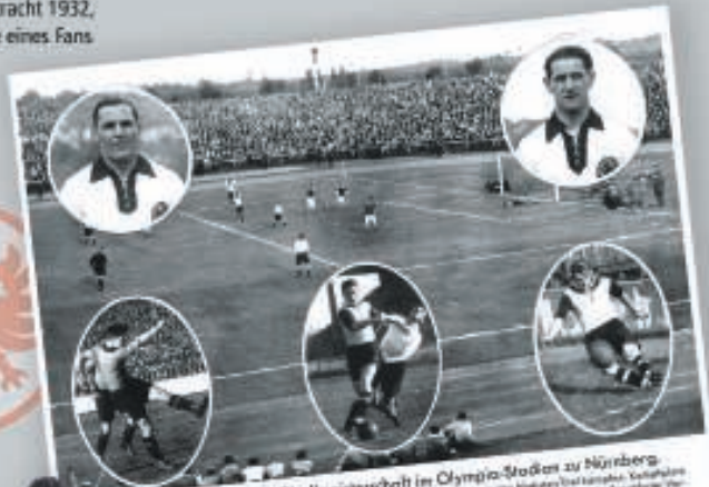
Am 12. Juni Deutsche Fußballmeisterschaft im Olympia-Stadion zu Nürnberg...